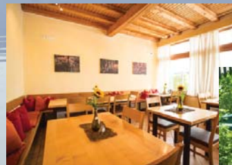
Bistro mit Biergarten