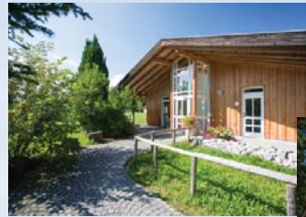
Zwei moderne, gepflegte Sanitärgebäude